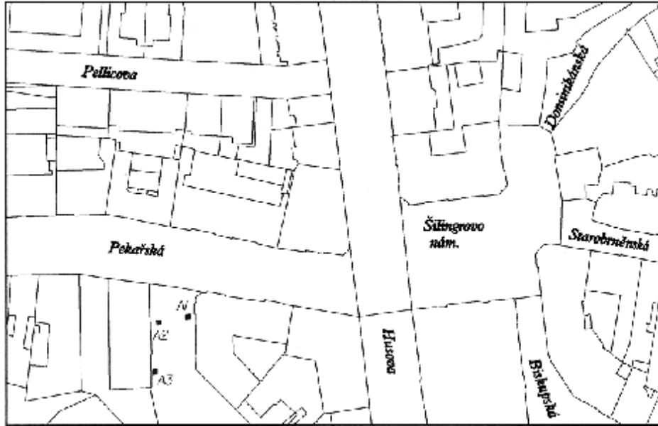
Obr. 2 Umístění sond v rámci ulice Pekařské.