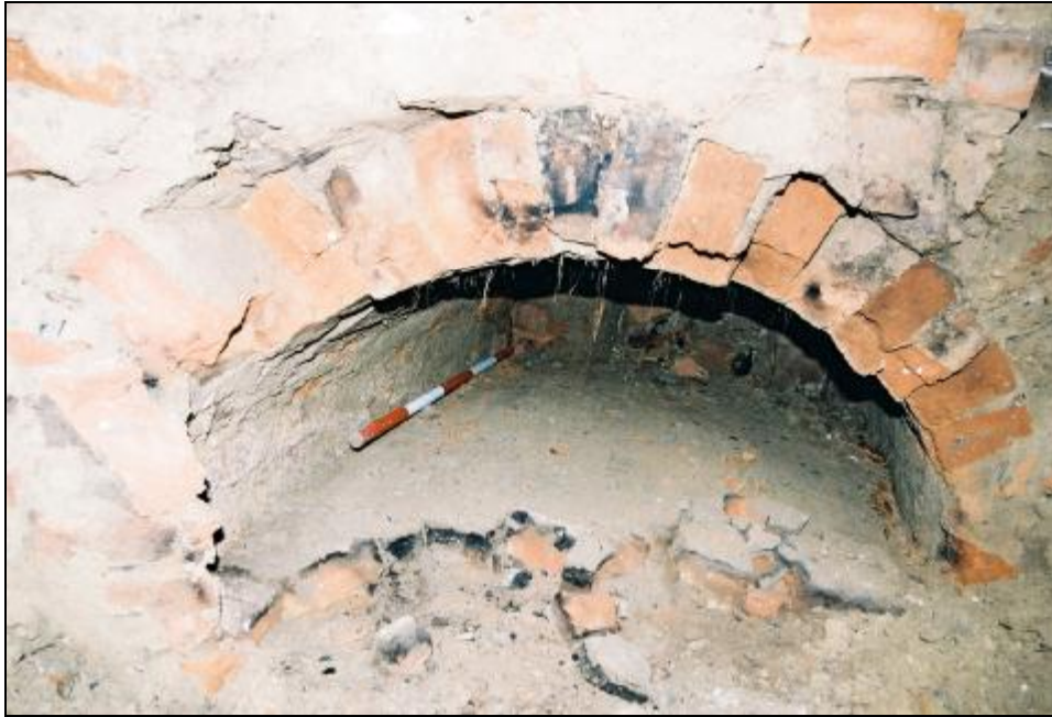
Obr. 4 Pohled ze sondy do topeniště pece.