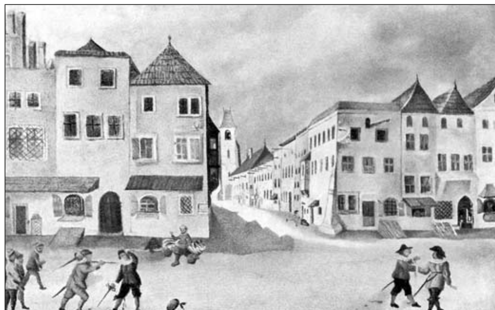
Obr. 3 M. Groer, nároží Sedlářské (Masarykovy) a Jánské ulice, 1644, olej na plechu (30,5 × 41,5 cm), Moravská galerie inv. č. 2348.

Řadový dvoupatrový dům, vystavěný na úzké parcele, je v přízemí hloubkově dělen do tří příčných traktů. Gotické jádro je rozpoznatelné pouze ve střední prostoro suterénu, snad druhotně zmenšené příčkou. Zbytky ostění portálu svou orientací ukazují na výstup severním směrem do dvora parcely. (Hanák – Hanáková 1989a, 25–29; Koběrská 1973, 276, 277)