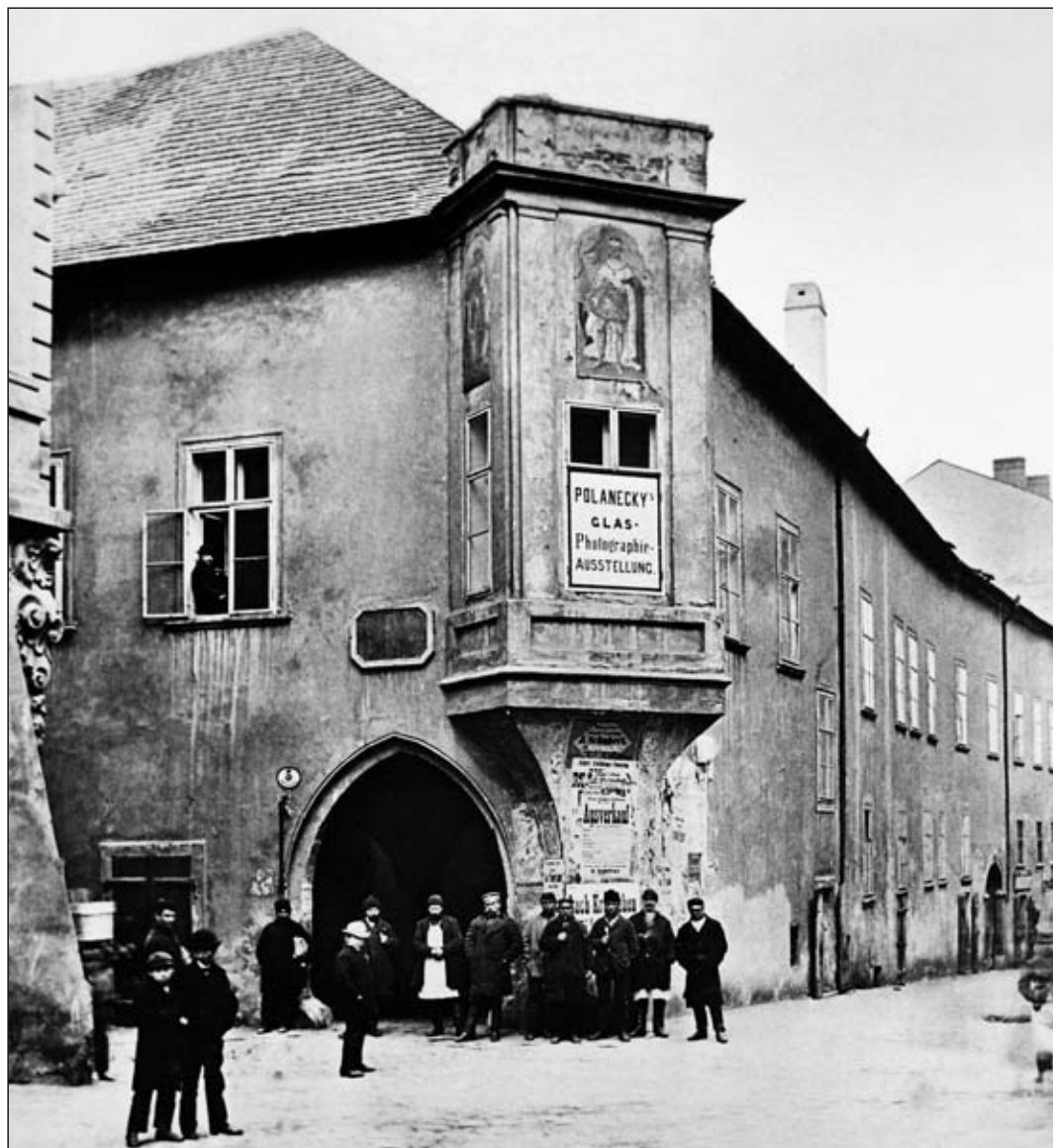
Obr. 2 Nároží dnes již neexistujícího hostince U tří knížat na nároží ulic Poštovské a Jánské s nepochybným gotickým jádrem na fotografii z doby těsně před asanací na počátku 20. století. AMB, U5, sign. XXV.

Budova ve svém základním dochovaném rozsahu představuje jádro jediné vrcholně gotické stavby z přelomu 13. a 14. století. Konstrukce západní stěny v úrovni suterénu, přízemí i patra mladšího charakteru ukazuje na pozdější vložení v období renesance, stejný charakter se jeví i při pohledu z prostoru domu č. o. 3. Za nejstarší jádro lze proto pokládat uliční trakt obou dnešních domů č. o. 1 a 3. V přízemí a 2. nadzemním podlaží se dochovaly pozůstatky stavební úpravy domu ze 14. století. Dům byl tehdy orientován okapově. Zděná přestavba přízemí i patra pravděpodobně nahradila dřevohliněné, snad hrázděné konstrukce. K rozdělení