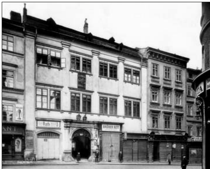
Obr. 4 Pohled na dům Panská 6–8 z roku 1908.