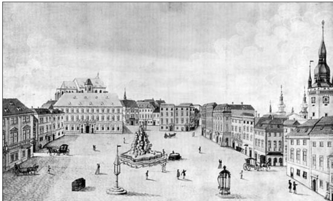
Obr. 7 J. Maserle, Pohled na západní stranu Zelného trhu, 1768, kvašová kresba na papíře podlepeném plátnem (64 × 39,5), MuMB inv. č. E 15 359.

Nárožní dvoupatrový dům o dvou hloubkově řazených traktech oddělených středovým průjezdem. Dům zahrnoval též dvě dvorní křídla zničená při náletu r. 1944 a r. 1945 odstraněná. V první fázi zaujímal podstatnou část, ne-li celé nároží, velký dřevohlinitý, podsklepený dům, který zanikl někdy na přelomu 13. a 14. století. Následně vznikl nárožní podsklepený objekt již zděný. V další etapě, možná však v podstatě současně,