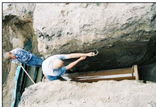
Obr. 3 - zčišťování stěny výkopu