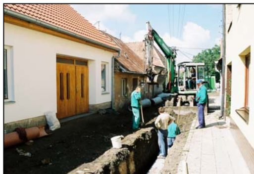
Obr. 2 - výkop pro kanalizaci

Nejstarší zjištěné osídlení náleží době bronzové. Byly zachyceny čtyři objekty ve výkopech na ulici Pšeničná a Mlýnská, které můžeme na základě keramického materiálu jen těžko blíže zařadit. Může se jednat o únětickou kulturu starší doby bronzové, nelze však ani vyloučit datování mladší. Zajímavými nálezy byly zlomky perleti a mušloviny, které byly získány ze dvou výkopů.