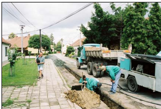
Obr. 4 - výkopy pro inženýrské sítě

Akce se částečně pravděpodobně dotkla i historického intravilánu města (v ulici Pšeničné), kde bylo možno sledovat aktivity přelomu 13. a 14. století. Konkrétně se jedná pravděpodobně o pozůstatek zahloubené části bližze neznámé dřevohliněné stavby.